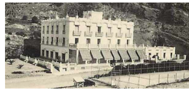
Hôtel des Thermes

Dans les années 1960, la station thermique de Korbous vit son destin se lier à celui du président Habib Bourguiba, fervent défenseur du patrimoine national. Il séjourne à plusieurs reprises dans la villa construite par Edmond Lecore-Carpentier. Le président et ses invités prestigieux mettent alors, une fois encore, les projecteurs sur la station thermique de Korbous.