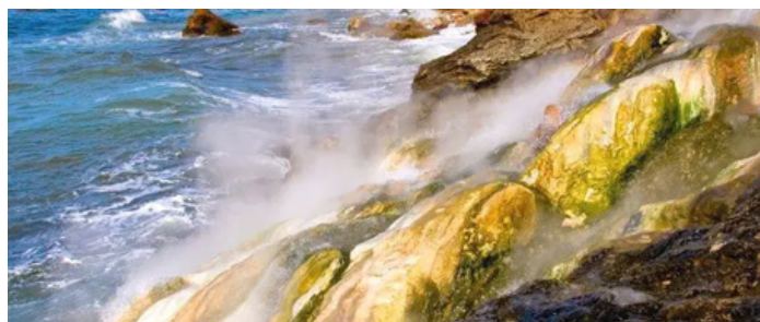
Mer et sources

A noter que l'hôtel fut construit tout près de la source Aïn Oktor, dont les eaux devinrent la première eau minérale tunisienne (1904) à être embouteillée. Elle fut d'abord vendue uniquement en pharmacies, avant sa distribution dans les commerces.