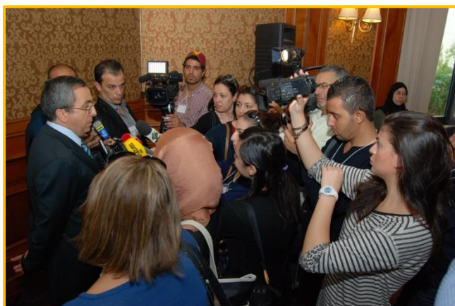
Conférence de Presse, GE : signature accord bilatéral Press Conference, GE: bilateral agreement signature