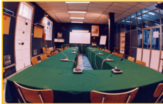
Mise en place des salles de travail Setting up the workrooms