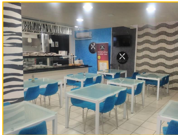
Espaces Déjeuner/Lunch zone