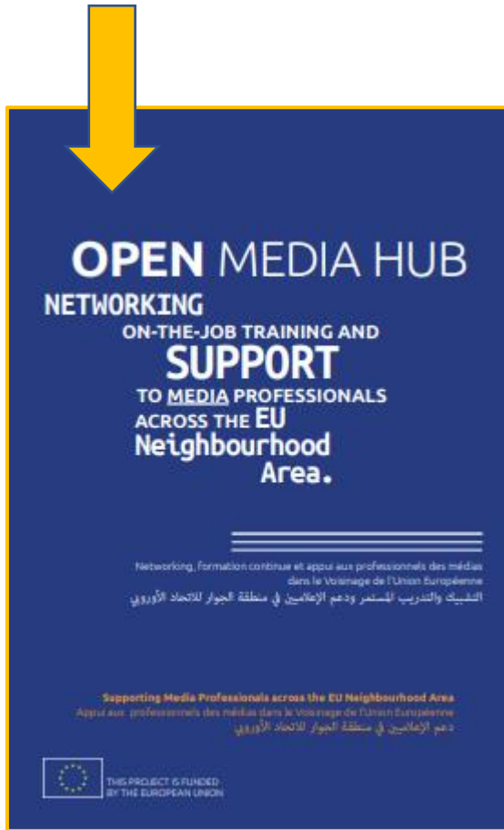
Affiche officielle/Official poster