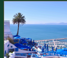
Sidi Bou Saïd