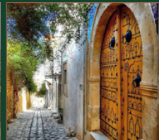
Medina de Tunis