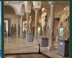
Musée du Bardo