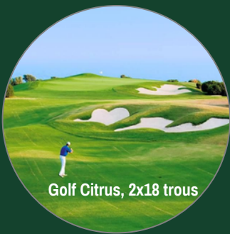
Golf Citrus, 2x18 trous

Activités, culture et détente se conjuguent aussi grâce aux excursions proposées par notre conciergerie Clefs d'Or : la découverte du Cap-Bon, mais aussi Tunis, Carthage ou Sidi Bou Saïd, pour explorer un patrimoine riche, culturel et archéologique.