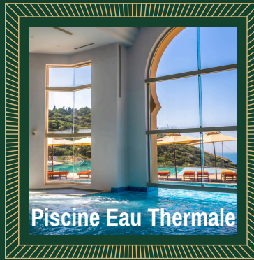
Piscine Eau Thermale

L'hôtel propose également des piscines intérieures et extérieures en eau de mer ou en eau thermale, un jacuzzi, un court de tennis, un boulodrome, ainsi que plusieurs départs de randonnées pédestres.