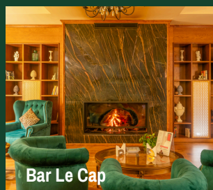
Bar Le Cap