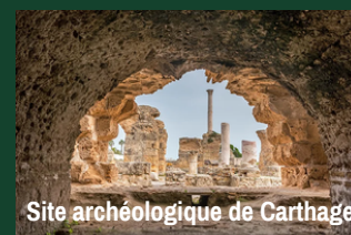
Site archéologique de Carthage

De nombreuses excursions sont organisées à partir de l'hôtel aux alentours de Korbous, dans le Cap-Bon, mais aussi à Tunis, Carthage et Sidi Bou-Saïd, le tout à moins de deux heures de distance de l'hôtel.